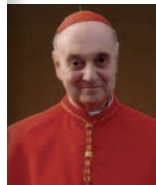
Se. Eminenz Angelo Cardinal Comastri

Dies war das erste Bekenntnis des christlichen Glaubens, es war das erste von einem Jünger gesprochene „Credo“. Und es erfüllte Jesus mit grenzenloser Freude. Von göttlicher Gewissheit erfüllt sprach er: „ Selig bist du, Simon Barjona; denn nicht Fleisch und Blut haben dir das offenbart (Simon war ein einfacher und ungebildeter Fischer!), sondern mein Vater im Himmel “.