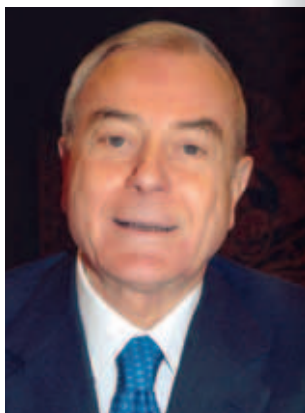
Dr. Gianni Letta

Schon ein kurzer Blick auf die Aktivitäten der „Fondazione pro Musica e Arte Sacra“ in den nur acht Jahren ihres Bestehens zeigt, dass es möglich ist, Dinge zu tun, die in der Welt der sakralen Kunst und deren Restaurierung und Erhaltung zunächst für unmöglich oder unwahrscheinlich gehalten wurden. Es gibt dafür ein einfaches Geheimnis: man braucht Männer und Frauen, die sich der großen Bedeutung der sakralen Kunst bewusst sind und denen es gelingt, andere Männer und Frauen zur Mitarbeit und zur konkreten Unterstützung dieser Tradition durch ihr Mäzenatentum zu bewegen. Und genau das ist auch hier geschehen.