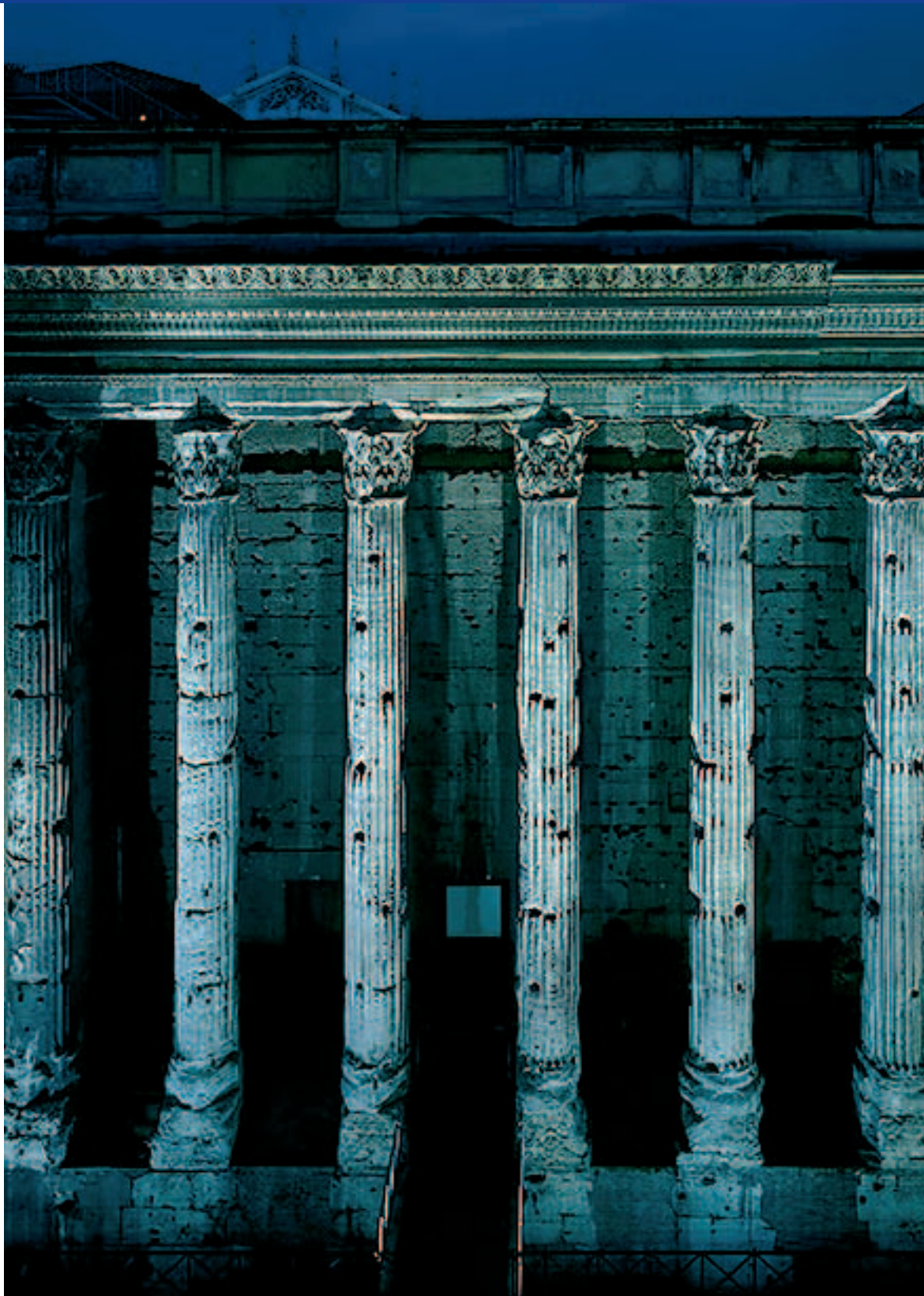
Der Hadriantempel, Sitz der Handelskammer Rom